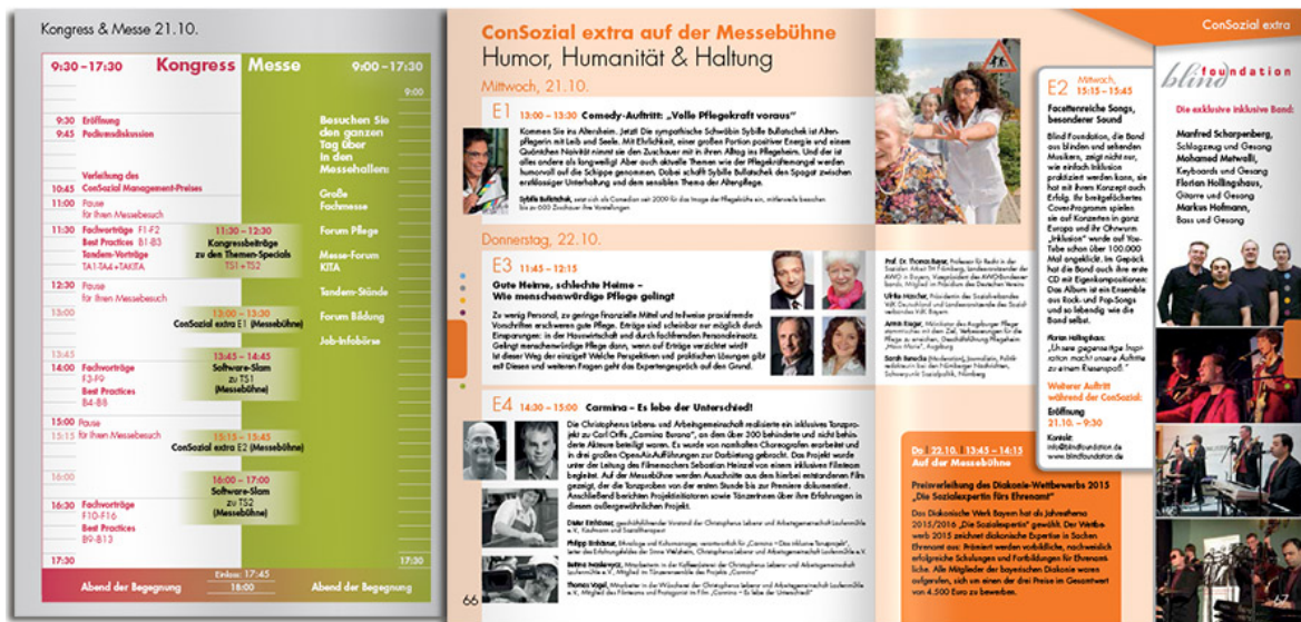
Programmheft 2015, S. 66/67 mit aufgeklapptem Umschlag (vorne, innen, Programmübersicht)

Nürnberg, 23.07.2015 - Seit Ende letzten Jahres setzt Deutschlands größte KongressMesse der Sozialwirtschaft, die ConSozial, auf das Können von RPF. Über ein halbes Jahr konstruktiver Zusammenarbeit mit dem Organisator und den Durchführungspartnern ist vergangen. Nun halten wir das druckfrische Programmheft 2015 in Händen, das RPF neu strukturieren und layouten durfte. Allerhöchste Zeit zu berichten, was sich sonst noch getan hat.